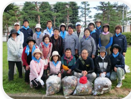
終了後に記念撮影