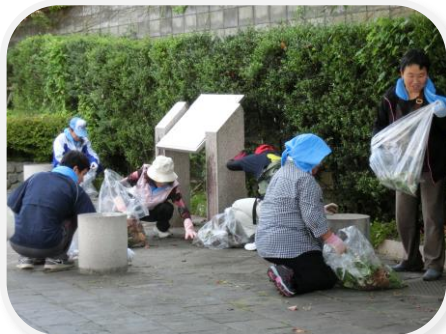
熱心にゴミを拾うボランティアの皆さん

9月20日（土）大熊町生活支援ボランティアセンターで第一回清掃ボランティア活動を行いました。お世話になっている会津若松市に少しでも役に立てばと思い活動を始めました。今回は、大熊町役場前にボランティアの皆さんが集合し、鶴ヶ城周辺を約1時間歩きゴミを拾いました。次回は、10月18日（土）。三回目は、11月15日（土）に行います。