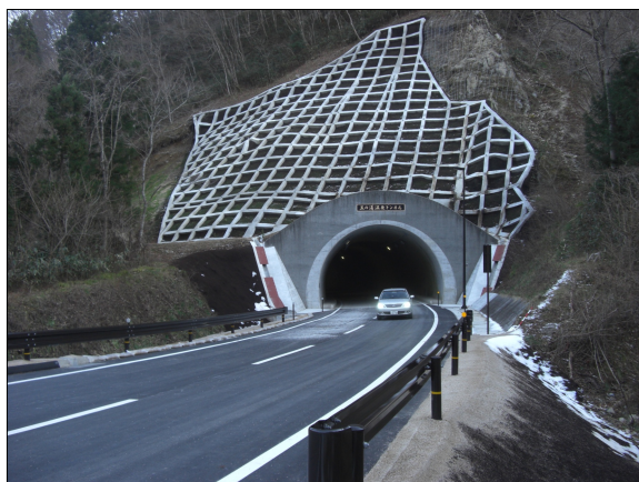
開通した玉ノ湯バイパス

大熊町野上の国道288号線玉ノ湯バイパスは12月25日午後3時、開通しました。平成16年度から工事を行い、東日本大震災と原発事故により休止されていましたが、平成26年1月に再開し、このほど完成しました。 バイパスは玉の湯温泉トンネルを含む全長425メートルです。車両のすれ違いが困難だった道幅は6メートルに広げられました。帰還困難区域内でのバイパス開通は初めてで、町民の一時立ち入りや除染など各種復興事業の車両の通行に活用されます。