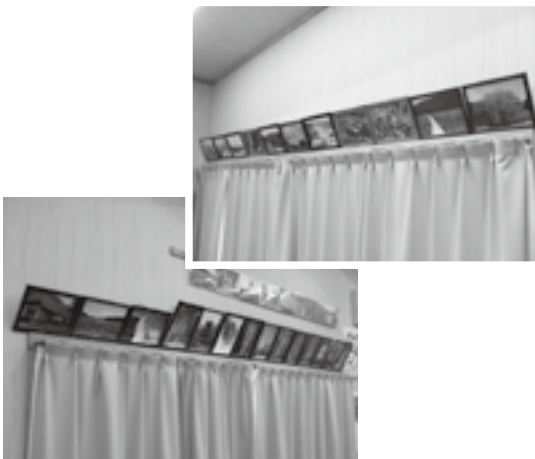
会津地方を中心に、様々な「四季の表情」を撮った写真が集会場に飾られている

住宅内の集会場に飾らせていただきました。ある時、集会場で警察官による「オレオレ詐欺」被害防止についての講話があり出席したところ、その警察官が私の写真に関心を示したため、自宅で撮り貯めた写真を見せたところ、とても喜んでいました。後日、その警察官から写真を会津若松警察署に飾らせてほしいとの要請があり、喜んで協力させていただきました。現在、同署ロビーにある展示コーナーで写真が掲示されています。昨年末には署長より感謝状をいただきました。同署では、私の写真が来訪者だけではなく、全国各地から応援で駆けつけている警察官の方々にもちよつとした憩いとなっているようで、日頃お世話になっている皆さんに少しは恩返しのようなことになっているのかと、逆に励まされています。