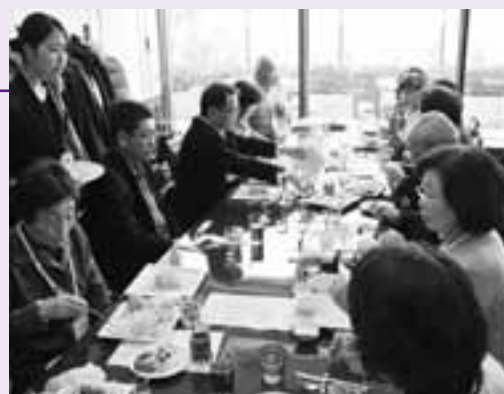
おいしい料理を楽しむ参加者

おいしい料理と町民同士の交流を楽しむ食事会「新宿 de おおくまランチ」は1月24日、東京都のクルーズクルーズ新宿で開かれました。約50人が参加し、フレンチやイタリ안의メイン料理やデザートなどを味わいました。日常とは一味違ったおしゃれな時間を過ごした参加者は、懐かしい同郷の人と和やかに歓談しました。参加者全員での記念撮影や横田菓子店のチーズブッセがもらえるくじ引きも行われ、楽しい思い出をつくっていました。