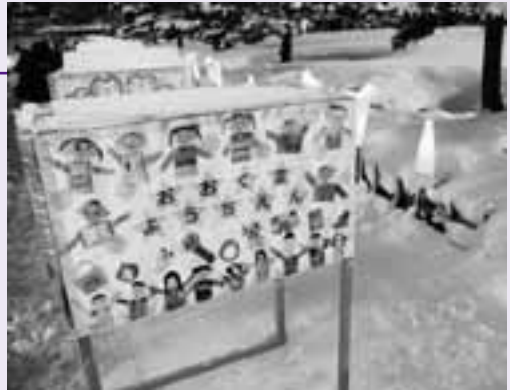
紹介された大熊幼稚園児の作品

会津の伝統工芸が城下町を彩る「会津絵ろうそくまつり」は2月13、14の両日、会津若松市の鶴ヶ城や御薬園などで催されました。このうち鶴ヶ城本丸には大熊町立幼稚園の園児が製作した行灯（あんどん）が展示されました。園児はそれぞれの似顔絵や「仮面ライダーのカード」「花模様のワンピース」など、大事にしている宝物をメッセージとして書き込みました。行灯はライトアップされた天守閣の前でほのかに光り、冬の夜に映えていました。