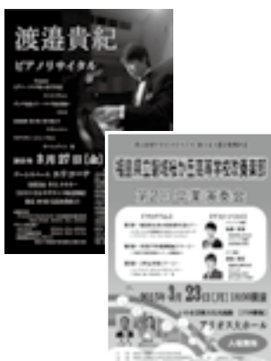
リサイタルのリーフレット(上)とリサイタル開催直前にゲスト出演する母校吹奏楽部演奏会のリーフレット(下)

これまでの思いを演奏に込め、皆さまとともにこれからの歩んでいくためのひと時にできれば幸いです。