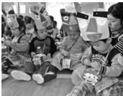
節分に豆を食べる園児