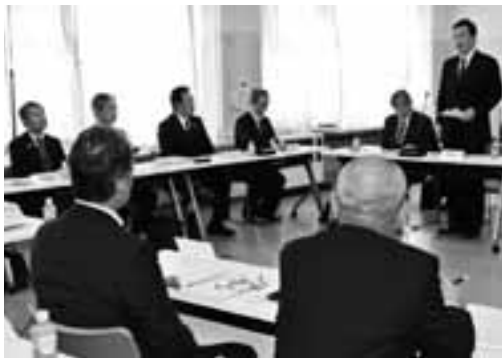
協定書案を説明した町議会全員協議会