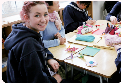
折り紙の鶴に喜びの笑み