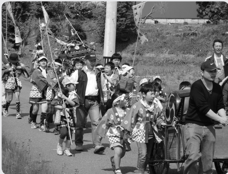
下矢田地区を練り歩く神輿

参加した大熊の子どもたちは、地元の子どもたちと一緒に太鼓を叩いたり、神輿を担いだりして地区のお祭りを盛り上げました。神輿は仮設住宅へも訪れ、地元住民と仮設住宅住民との交流が深まりました。