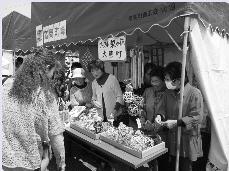
サークル「梨の花」のみなさん

渡辺町昼野仮設住宅内のサークル「梨の花」が5月5日、昨年に引き続き植田本町通り歩行者天国に参加し、サークルで製作した籠や人形など、手芸品の展示・販売を行い、訪れたいわき市民と交流し楽しい時間を過ごしました。