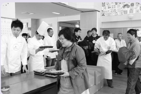
シェフから料理を受け取る参加者