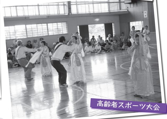
高齢者スポーツ大会