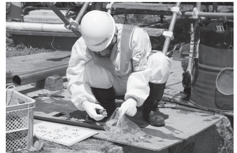
土砂等を採取する調査員