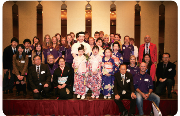
バースト市訪問団と国際交流協会員の皆さん

翌22日には大熊中学校を訪れ、1～3年生の各教室に分かれて授業を体験しました。授業では、習字や折り紙、けん玉など、日本の文化を体験しました。四苦八苦しながらも協力して出来上がった作品に、生徒たちからは歓声が上がっていました。