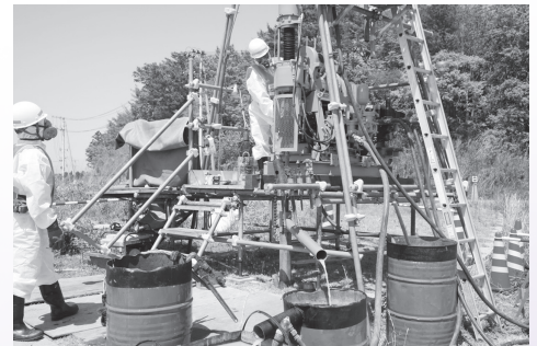
ボーリング調査の様子