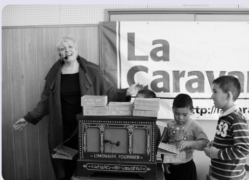
参加者と歌うスブリームさん

フランス料理シェフと大熊町民とのお花見が4月21日、松長コミュニティセンターで行われました。