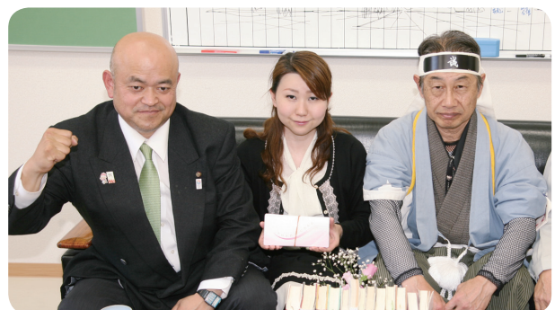
「東北を支援する日野市民の会」のみなさん