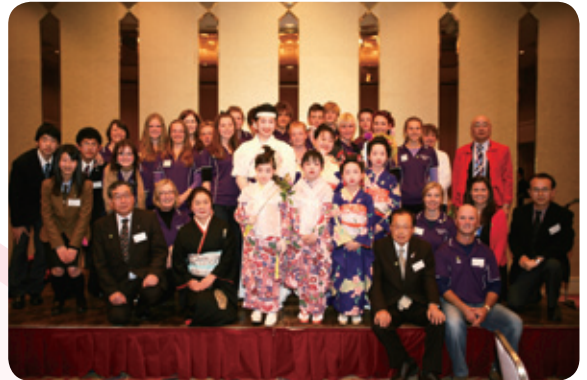
バサースト市訪問団と国際交流協会員の皆さん

翌22日には大熊中学校を訪れ、1～3年生の各教室に分かれて授業を体験しました。授業では、習字や折り紙、けん玉など、日本の文化を体験しました。四苦八苦しながらも協力して出来上がった作品に、生徒たちからは歓声が上がっていました。