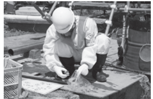
土砂等を採取する調査員