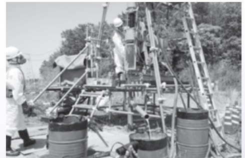
ボーリング調査の様子