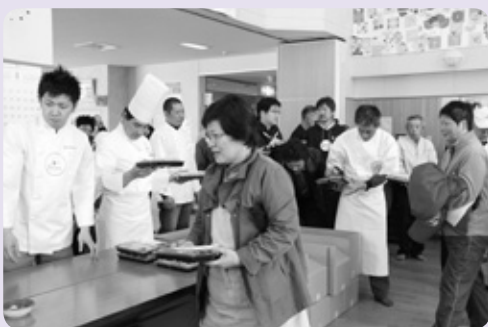
シェフから料理を受け取る参加者

フランス料理シェフと大熊町民とのお花見が4月21日、松長コミュニティセンターで行われました。