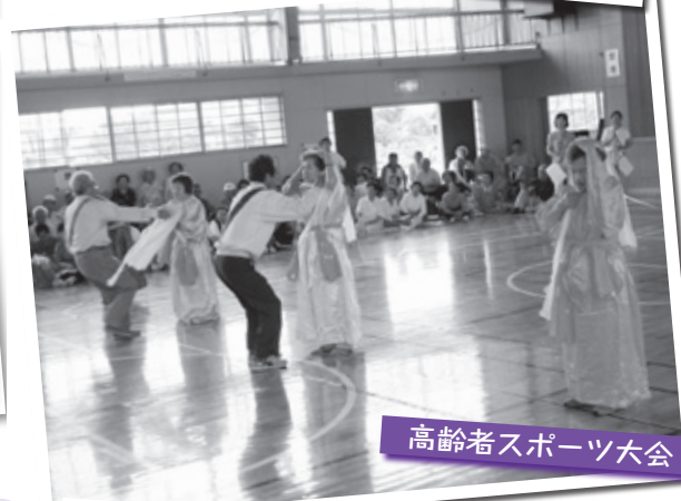
高齢者スポーツ大会