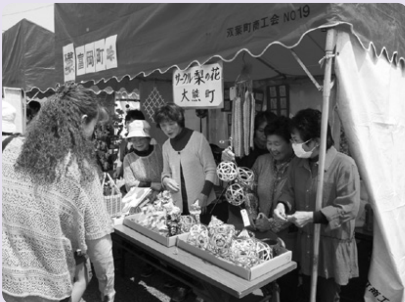
サークル「梨の花」のみなさん

渡辺町昼野仮設住宅内のサークル「梨の花」が5月5日、昨年に引き続き植田本町通り歩行者天国に参加し、サークルで製作した籠や人形など、手芸品の展示・販売を行い、訪れたいわき市民と交流し楽しい時間を過ごしました。