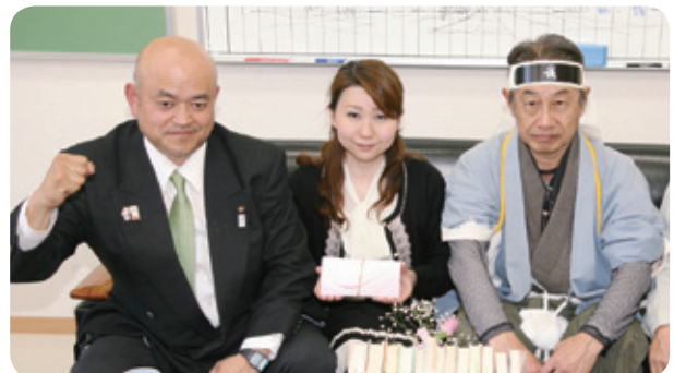
「東北を支援する日野市民の会」のみなさん