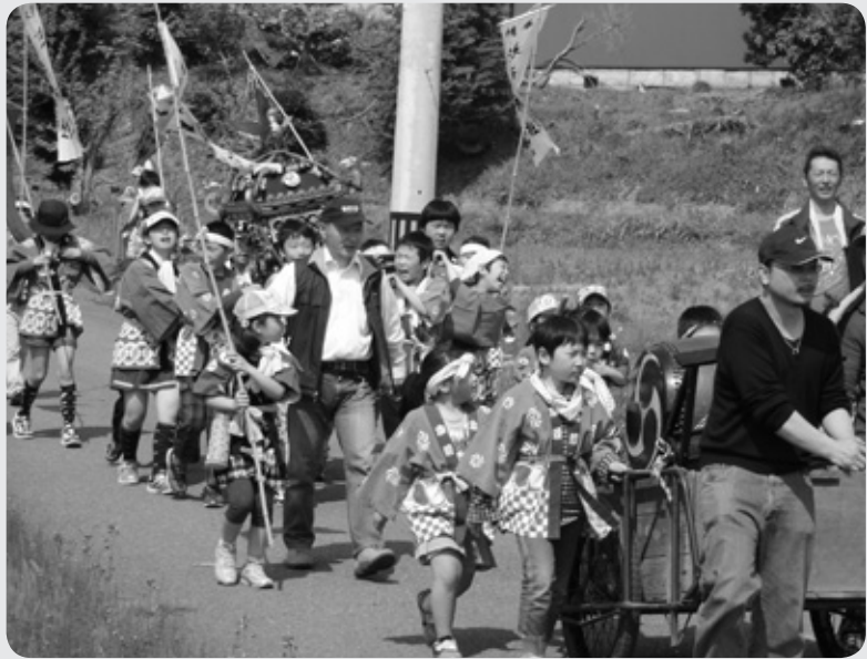
下矢田地区を練り歩く神輿

参加した大熊の子どもたちは、地元の子どもたちと一緒に太鼓を叩いたり、神輿を担いだりして地区のお祭りを盛り上げました。神輿は仮設住宅へも訪れ、地元住民と仮設住宅住民との交流が深まりました。