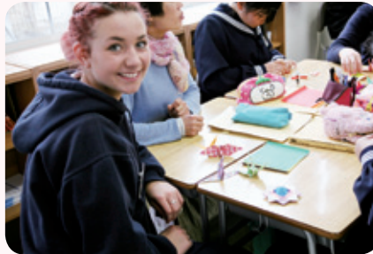
折り紙の鶴に喜びの笑み