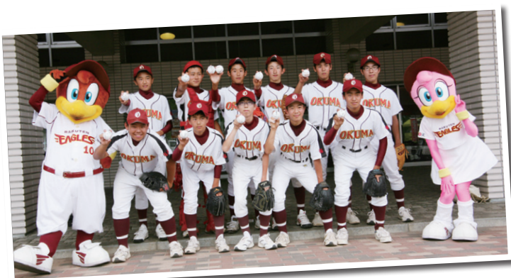
大熊中学校野球部員

イースタン・リーグ公式戦「東北楽天ゴールデンイーグルス VS 横浜DeNAベイスターズ」の試合が6月15日、会津総合運動公園あいづ球場で開催され、熱戦が繰り広げられました。楽天球団のご厚意により大熊町民も招待され、生でプロの試合を観戦しました。