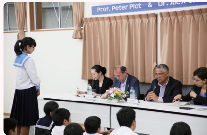
英語で質問する生徒