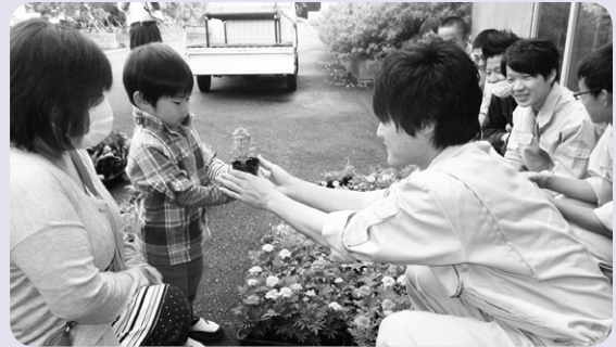
かわいいお客さん

販売時間前から多くの町民が会場に詰めかけ、販売が始まると生徒たちが愛情込めて育てた苗を次々と手にとって買い求めていました。