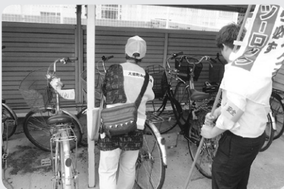
自転車の施錠確認