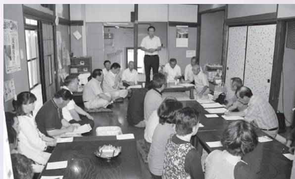
町議会議員との座談会