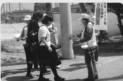
安全を呼びかける隊員

いわき市好間工業団地仮設住宅入居者で組織する「大熊町防犯みまもり連絡隊」と、好間地区に避難する富岡町民でつくる「パトロール富岡隊」が、地元好間町の地域の安全に貢献したいと活動をしています。