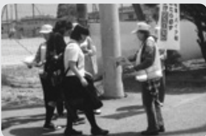
安全を呼びかける隊員

いわき市好間工業団地仮設住宅入居者で組織する「大熊町防犯みまもり連絡隊」と、好間地区に避難する富岡町民でつくる「パトロール富岡隊」が、地元好間町の地域の安全に貢献したいと活動をしています。