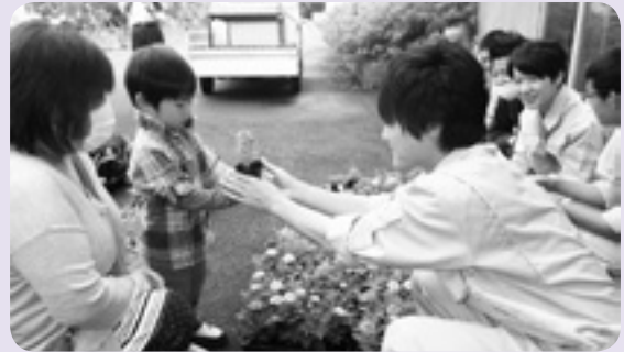
かわいいお客さん

販売時間前から多くの町民が会場に詰めかけ、販売が始まると生徒たちが愛情込めて育てた苗を次々と手にとって買い求めていました。