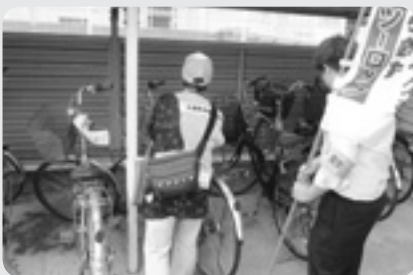
自転車の施錠確認