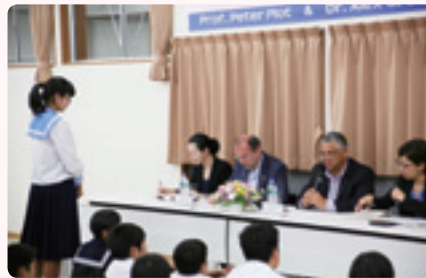
英語で質問する生徒