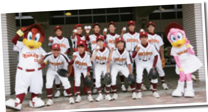
大熊中学校野球部員

イースタン・リーグ公式戦「東北楽天ゴールデンイーグルス VS 横浜DeNAベイスターズ」の試合が6月15日、会津総合運動公園あいづ球場で開催され、熱戦が繰り広げられました。楽天球団のご厚意により大熊町民も招待され、生でプロの試合を観戦しました。