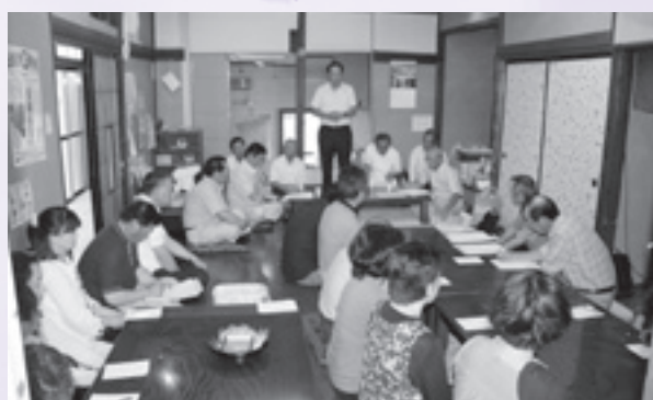
町議会議員との座談会