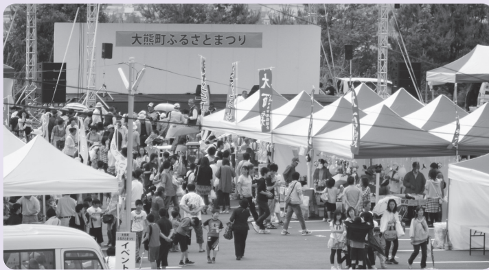
昨年の会津会場の様子

開催内容 決まり次第お知らせします。 ※11月にはいわき市での開催を 予定しています。