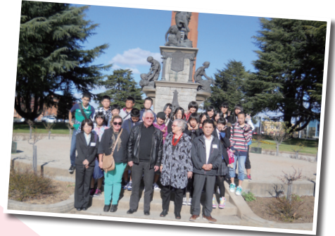
ビクターズセンターで記念撮影