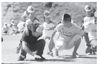
新しい顔を取り戻せ