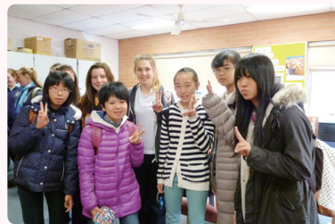
ホストファミリーと一緒に