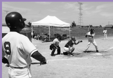
壮年ソフトボール