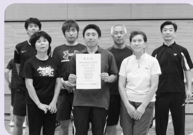
バドミントン表彰