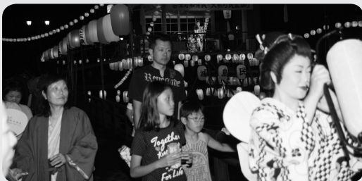
相馬盆唄の踊りの輪