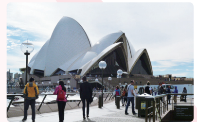
シドニー市内視察