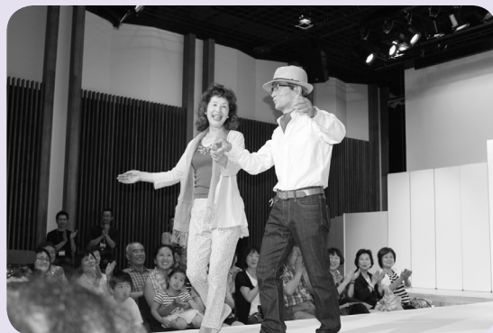
観客の前でポーズ

参加者の多くが「一生の思い出になった。」「またあったら出たい。」と、笑顔で話していたのが印象的でした。