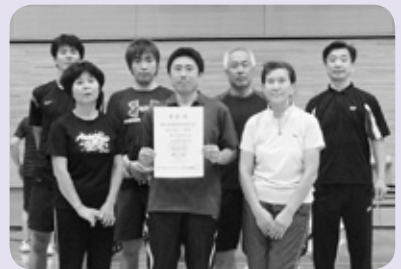
バドミントン表彰