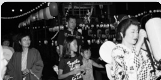
相馬盆唄の踊りの輪