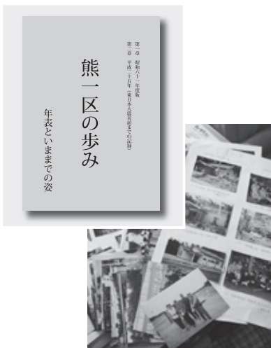
発行された「熊一区の歩み」と提供を受けた写真の一部

避難以降、私は体調を崩すことが多くなりました。特に、膝を痛めるなどしたため、長時間歩くことが難しくなりましたが、痛いから歩かないというのは悪循環になるため、震災前から続けているパークゴルフや各種行事には可能な限り参加するなどして、妻とともに故郷を思いながら日々を送っています。