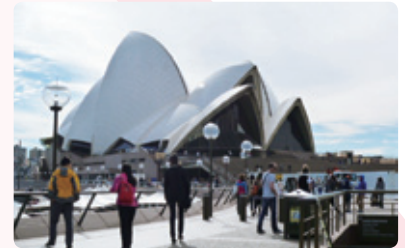
シドニー市内視察