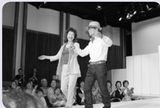
観客の前でポーズ

参加者の多くが「一生の思い出になった。」「またあったら出たい。」と、笑顔で話していたのが印象的でした。