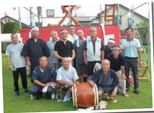
招待された皆さん

同市には大熊町民をはじめ、多くの福島県民が避難しており、祭りの実行委員会から「今年はぜひ避難している方も祭りに参加