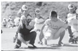
新しい顔を取り戻せ