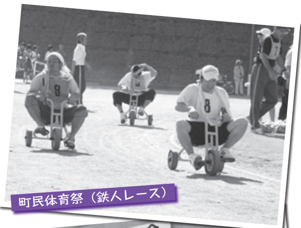
町民体育祭（鉄人レース）