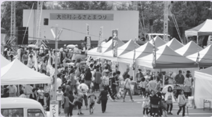
昨年の会津会場の様子

開催内容 決まり次第お知らせします。 ※11月にはいわき市での開催を 予定しています。