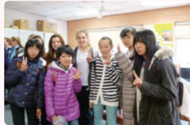
ホストファミリーと一緒に