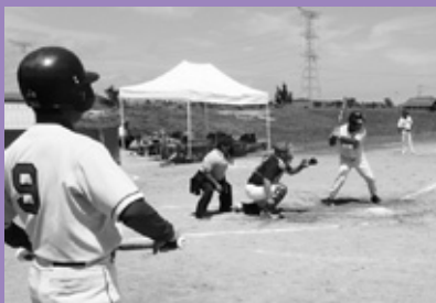
壮年ソフトボール