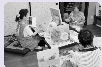
油絵に取り組むメンバー

毎月第2・第4水曜日におおくまサロン「ゆっくりすっぺ」で活動しています。見学も可能ですので、絵に興味のある方は、ぜひご参加ください。