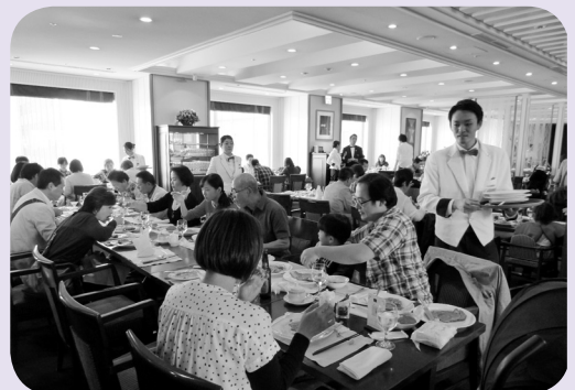
ランチバイキングに舌つづみ