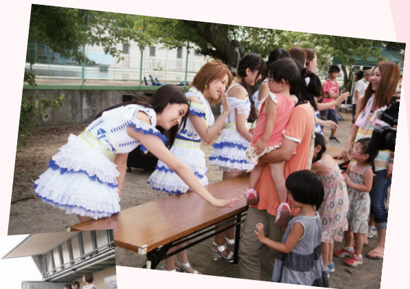
メンバーとハイタッチする参加者

※大熊町からお配りしているタブレット端末の「ビデオメッセージ」でも、当日の様子を映した動画がご覧になれます。