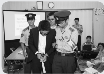
送りつけ商法の寸劇

会津若松警察署復興支援係主催による防犯教室が8月19日、一箕町長原地区仮設住宅の集会所で開催され、約50人の町民が悪質商法の手口や防犯対策を学びました。