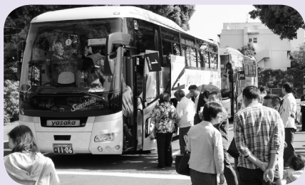
大型バスで上野を出発

200人が参加し、家族連れも多く、スカイツリーからの眺めに子どもも大人も大喜びでした。スカイツリーの後は、二重橋または浅草寺などを巡り、メインイベントの帝国ホテルでのランチバイキングでは、美味しい料理に舌つづみを打ちながら、懐かしい大熊町の話で盛り上がり、長引く避難生活の中にも充実したひとときをすごしていました。