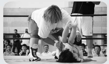
プロレス教室の様子