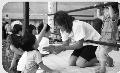
選手とふれあう子どもたち